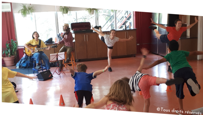
Notes et Hop!, avec Côté Cours Côté Jardin

Ce nouveau poste est né suite au constat d'une transformation de nos réseaux de diffusion, de plus en plus complexes et multiples : il fallait les travailler différemment, afin de pouvoir mieux les développer. Ainsi, nos spectacles en salle ont été pris en charge par Scène Ouverte et son agente de diffusion, et nous avons gardé à l'interne le développement des réseaux scolaires et communautaires. Cette nouvelle approche nous a permis de renforcer nos liens avec les acteurs de ces réseaux et d'en affiner notre compréhension, avec comme résultat, non seulement l'élargissement de nos possibilités de diffusion et l'enrichissement de nos projets de médiation culturelle, mais aussi l'accès à des citoyen.nes consommant peu de culture. Aussi, cette proximité avec le communautaire permet de faire valoir l'apport considérable des arts et de la culture sur le développement et le bien-être des individus.