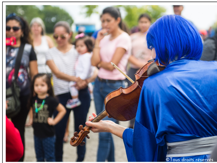
Maelström en promenade, parc Frédéric Bach