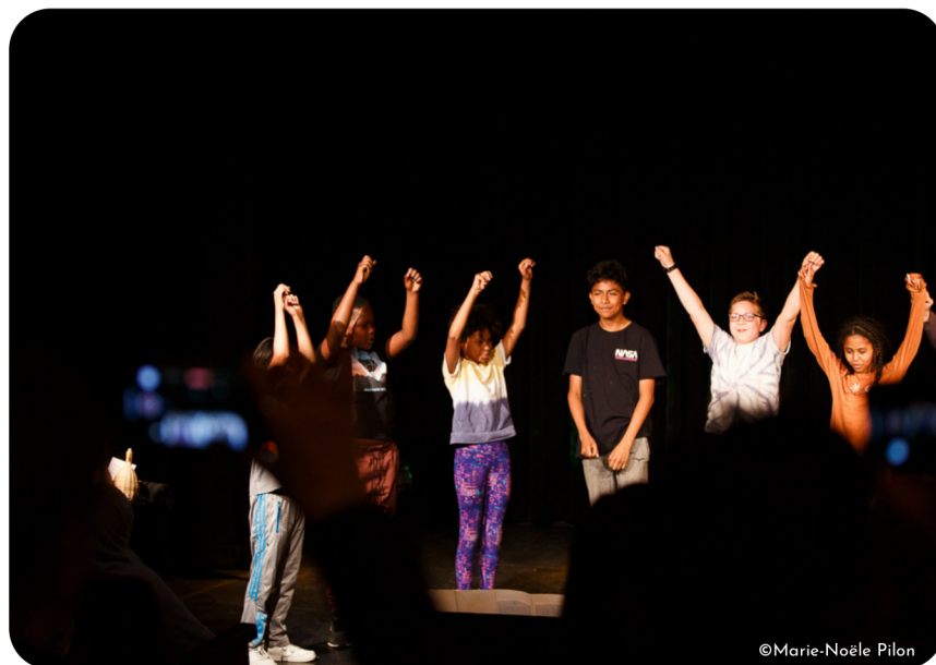
Projet de médiation culturelle avec les classes d'accueil de l'école Ste-Germaine-Cousin.

Nous sommes encore en apprentissage et en formation en ce qui concerne les bonnes pratiques en la matière, mais nous souhaitons, durant la prochaine année, mettre en place une politique pour la diversité, l'équité et l'inclusion, comportant un plan de développement, des perspectives et des actions concrètes.