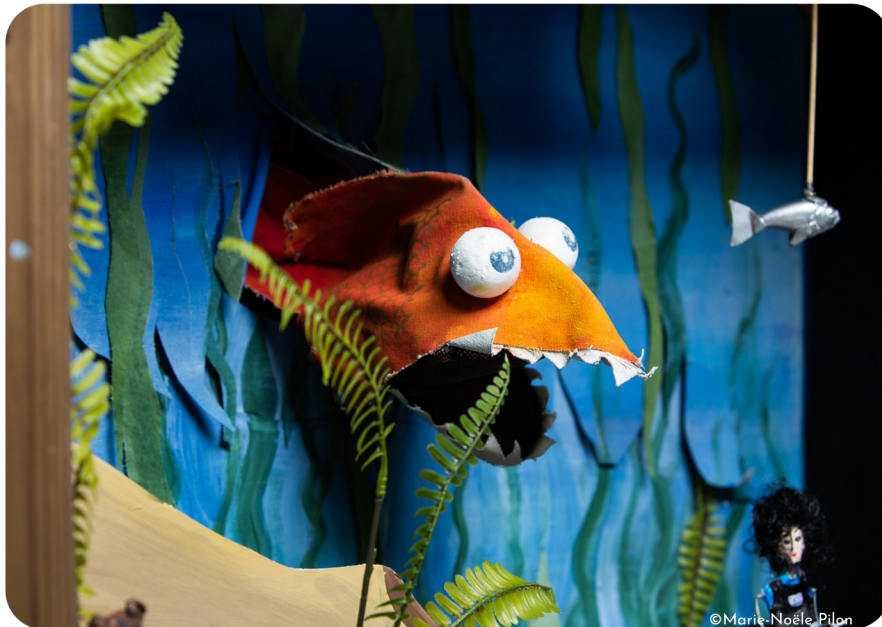
La conception des nouveaux décors de Tableaux Musique a reçu l'aide d'Éco-Sceno, dans un souci d'écoresponsabilité avec le soutien du Conseil des arts de Montréal

L'écoresponsabilité est une préoccupation de longue date du Moulin à Musique qui a toujours pris soin de minimiser l'impact de ses créations et activités sur l'environnement. Pourtant, l'organisme ne s'est encore jamais doté d'une politique écoresponsable claire, formalisant et standardisant ces pratiques de façon réfléchie et cohérente. La prochaine saison verra donc le début des travaux pour la création d'une telle politique. Nous pourrions ainsi développer de nouvelles pratiques écoresponsables, tout en consolidant celles que nous avons déjà. La première étape sera la création d'un comité vert au sein de notre conseil d'administration, afin d'épauler l'équipe pour la réflexion et la rédaction de la Politique et du plan d'action.